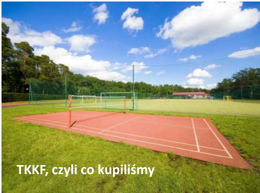
TKKF, czyli co kupiliśmy